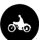
Fig. 62 - Motopista