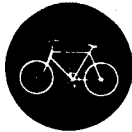
Fig. 50 - Pista ciclabile مرور الدراجات