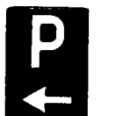
Fig. 66 b - Parcheggio الانتظار الى اليسار