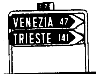
Fig. 101 - Segnali di direzione e di identificazione strade montati su archetto.