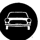
Fig. 63 - Riservato alle autovetture