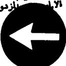
Fig. 54 a - 54 b - Direzione obbligatoria