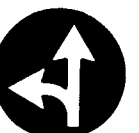
Fig. 58 b - Direzioni consentite