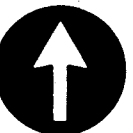
Fig. 55 c - Direzione obbligatoria