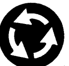
Fig. 57 - Rotatoria