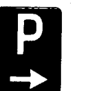
Fig. 66 c - Parcheggio الانتظار الى اليمين