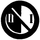
Fig. 49 a - Sosta vietata dal lato della cifra « I » - I giorni di data dispari, dal lato della cifra « II » - I giorni di data pari; ممنوع الوقوف على الجانب رقم ٢ في الايام المنفردة