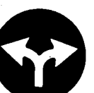
Fig. 58 a - Direzioni consigliate