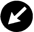
Fig. 55 b - Direzione obbligatoria