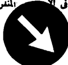
Fig. 55 a - Direzione obbligatoria