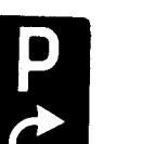
Fig. 66 e - Parcheggio