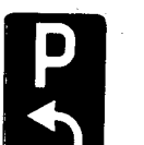
Fig. 66 d - Parcheggio