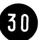
Fig. 64 - Limite minimo di velocità